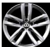
Легкосплавные диски «Salvador» Volkswagen R, 7 J x 17, (PJD)