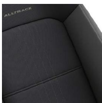
Тканевая обивка сидений "Alltrack"